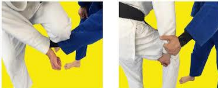
pomaganie sobie nogą przy zrywaniu uchwytu przeciwnika