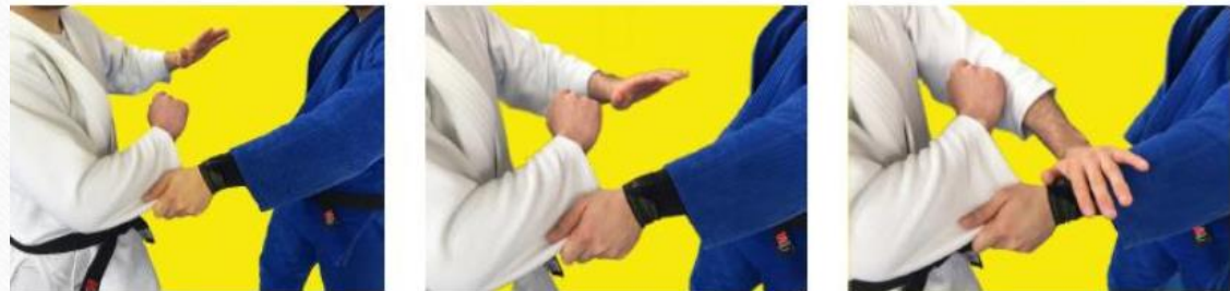
unikanie uchwytu przeciwnika przez odbicie/uderzenie ręki