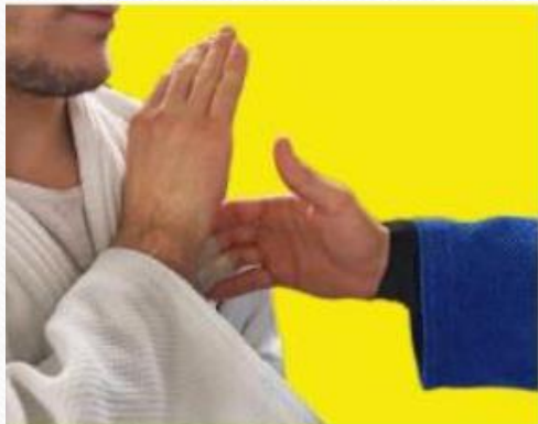
zakrywanie dłonią własnego kołnierza w celu uniknięcia uchwytu przeciwnika