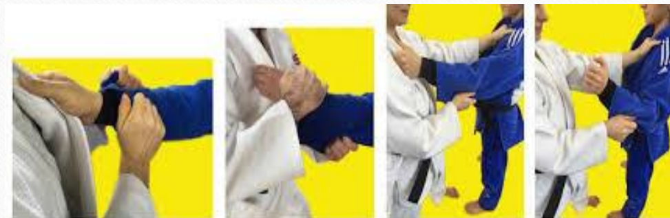
zrywanie uchwytu przeciwnika przy użyciu dwóch rąk